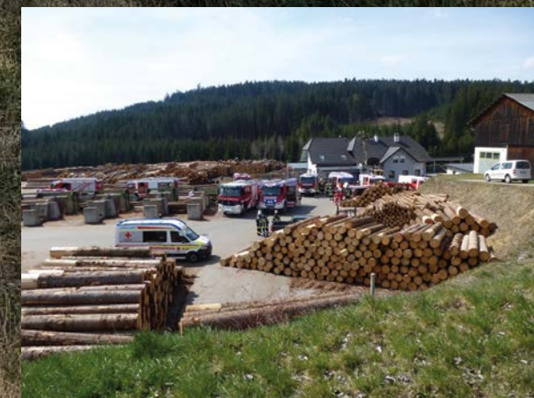
Brandeinsätze in Hundsbach ( 6 Feuerwehren) und Bärnkopf (3 Feuerwehren)