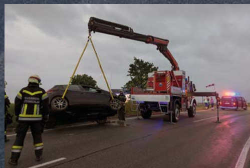
VU B36 beim Flugplatz