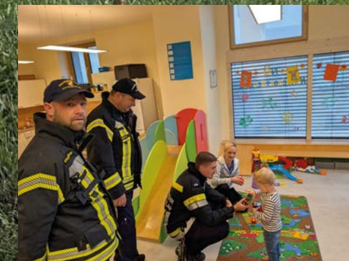
Räumungsübungen in den Einrichtungen der NÖ-Kinderbetreuung dem Kindergarten, dem Sonderpädagogischen Zentrum sowie in der Mittelschule