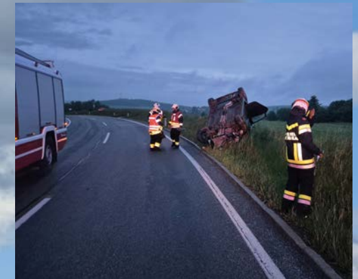
VU B36 beim Flugplatz