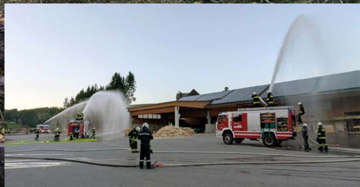
Brandeinsatzübung - Sägewerk Ableitinger