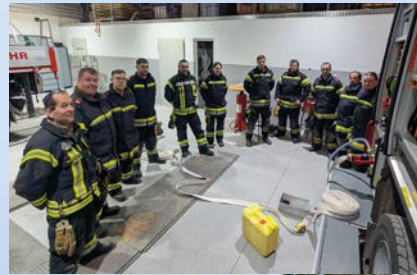
Schulung HLF 3