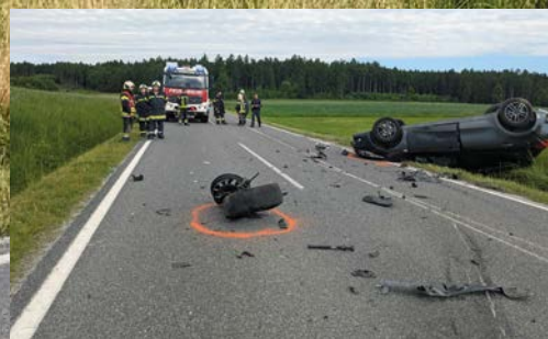
VU Richtung Reichpolds