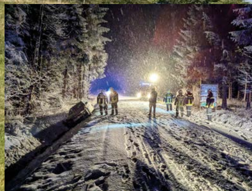
VU - Einsatz mit FF Kirchschlag