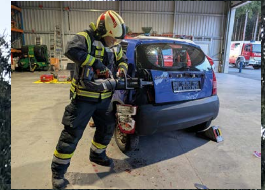
Technische Übung in Martinsberg 2025