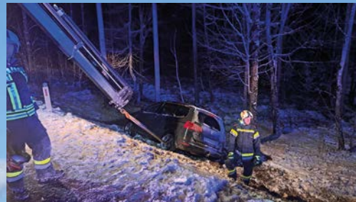
PKW Bergung nach VU

Insgesamt 393 Ereignisse mit 9509 Stunden!